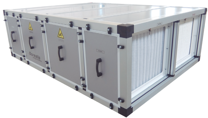
HS: Equipos horizontales de altura reducida

Las gamas HS y HV de deshumidificadoras Borealis están diseñadas con los mismos estándares que nuestras grandes unidades HH. De este modo, las instalaciones de piscinas de pequeño y mediano tamaño y los spas también pueden equipar máquinas de calidad, con las prestaciones que requieren los proyectos e instalaciones profesionales.