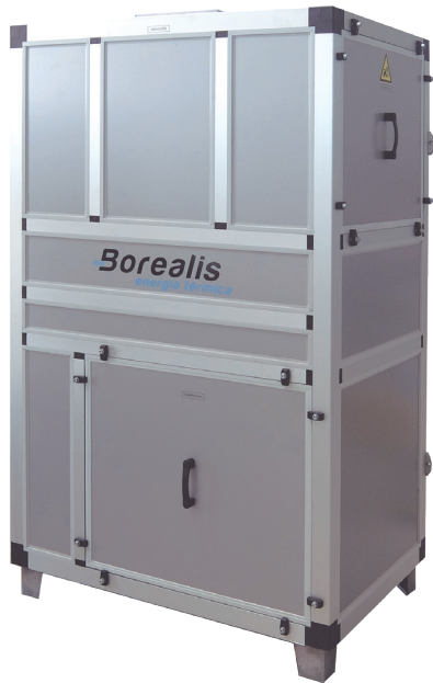
HV: Equipos compactos verticales